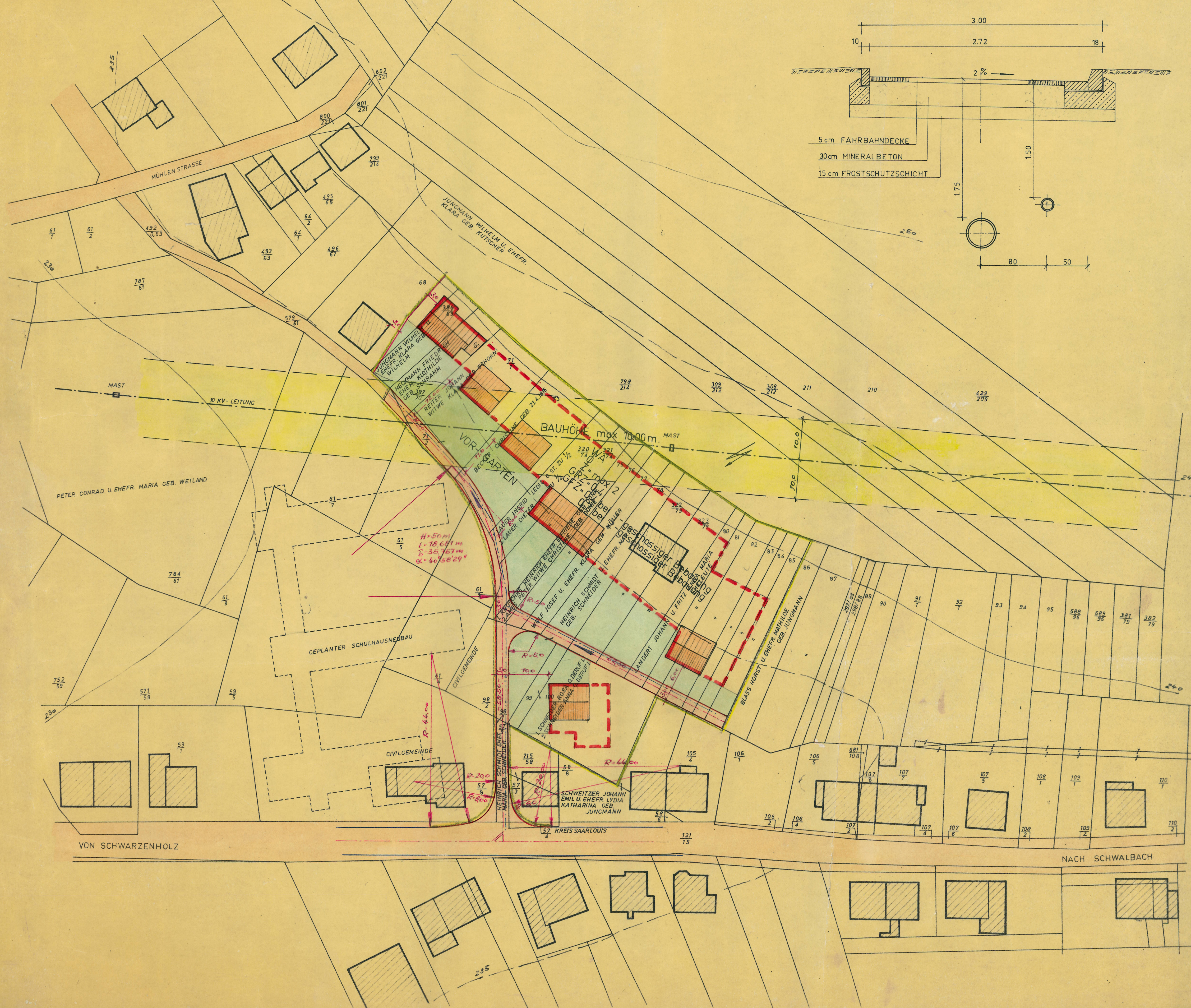
REGELQUERSCHNITT M. 1:25